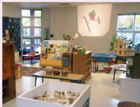
Un vieux rétroprojecteur a trouvé une nouvelle utilisation : l'exploration de la lumière.

Ma deuxième priorité était de concevoir un environnement qui encouragerait la créativité et l'imagination dans chaque coin de la classe. J'ai choisi d'enlever la cuisinière, l'évier et le frigo pour enfants ainsi que les costumes du jeu dramatique qui se retrouvent typiquement dans les classes de maternelle et de combiner à la place les gros blocs avec des poupées, de la vaisselle, des paniers, des dinettes et des verges de tissus. J'espérais qu'en m'éloignant du matériel de jeu standard, quelque peu prescrit en Amérique du Nord, cela permettrait d'ouvrir les possibilités de jeu dramatique. J'ai observé les enfants en train de jouer dans cette nouvelle aire de jeu dramatique et j'ai constaté qu'ils utilisaient les matériaux de manière créative. Je crois que ces matériaux moins limitatifs ont permis aux enfants de créer ce dont ils avaient besoin pour leurs jeux. Les gros blocs creux pouvaient devenir une voiture, un bateau, un fort ou encore un évier ou une cuisinière. Les verges de tissus pouvaient servir de nappe, de tente, de cape, de robe ou de sari. Les possibilités étaient illimitées et les enfants en avaient le plein contrôle.