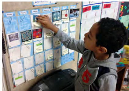
Un enfant consulte le calendrier visuel de la classe.

Quelle que soit la formule adoptée, la classe de maternelle doit favoriser la mise en place d'une atmosphère détendue qui accorde le temps nécessaire aux enfants pour élaborer des projets, mener des enquêtes et se livrer à des jeux dramatiques favorisant la communication et la coopération.