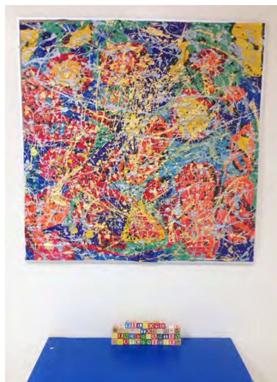
Les enfants ont réalisé une grande peinture murale qui est exposée dans le vestibule de leur classe de maternelle.