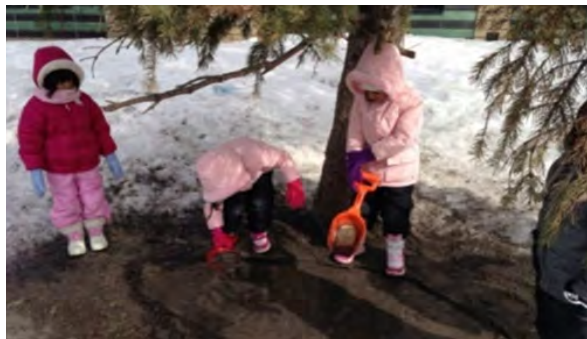
Des enfants creusent dans la neige et la boue.

L'enseignant peut prévoir des périodes de jeu actif à l'extérieur pour les enfants à un moment où les enfants des niveaux scolaires supérieurs ne sont pas encore sortis de manière à ce que les enfants de maternelle aient la possibilité de maîtriser des compétences sans subir de pression de la part d'enfants plus âgés.