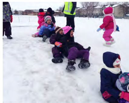
Des enfants glissent d'une petite colline.