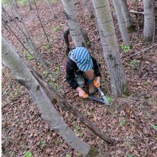
Un enfant utilise un véritable outil pour couper des branches mortes pour l'abri qu'il construit dans les bois.

«Les adultes peuvent contribuer à la sécurité des enfants en leur offrant un environnement riche qui leur permet de prendre plus de risques, tout en les guidant grâce à une succession d'expériences de difficulté progressive» [traduction libre] (Warden, 2012, p. 108).