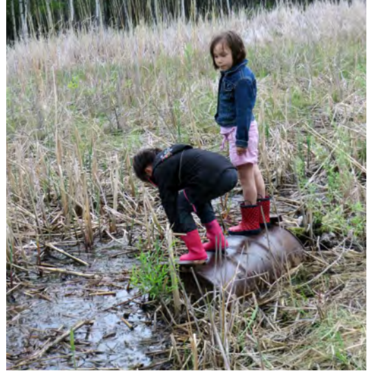
Deux fillettes à la recherche de grenouilles dans un terrain marécageux se mettent au défi de grimper et de rester en équilibre sur un bidon.