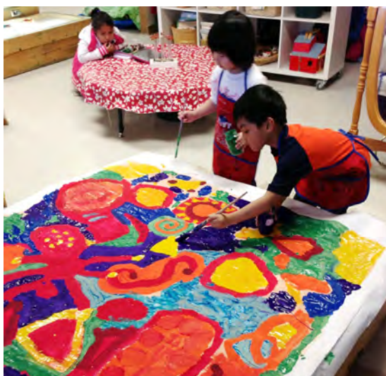
Les enfants participent à la création d'une peinture collective.