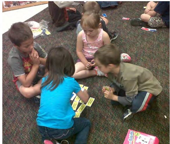
Des enfants jouent à un jeu simple avec des règles.

Selon leurs expériences antérieures, les enfants pourraient avoir besoin d'aide pour interagir dans des groupes, apprendre la gratification différée et trouver du plaisir à coopérer avec les autres et à faire preuve de générosité à leur égard. La plupart des enfants de cinq ans sont déjà en train de s'éloigner de l'égoïsme qui domine dans les phases de développement des enfants plus jeunes et commencent à reconnaître qu'ils ne peuvent pas toujours prendre des décisions basées uniquement sur leurs besoins et leurs désirs. Le désir de faire partie du « nous » et d'obtenir l'approbation de leurs pairs les aident à dépasser le « moi » égoïste. Le rôle de l'enseignant qui tient à favoriser les interactions sociales positives consiste à créer un milieu d'apprentissage axé sur le jeu incluant un horaire souple, un aménagement de l'espace réfléchi et l'exploitation des occasions d'apprentissage spontanées.