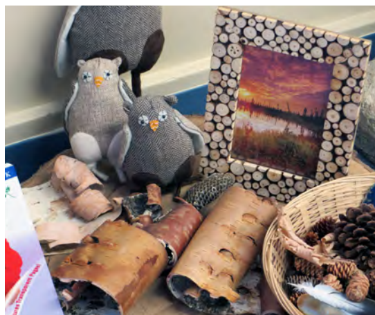
Des expositions au sujet de la nature permettent aux enfants de toucher et d'explorer des objets et des matériaux naturels.