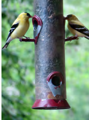
Les enfants peuvent observer la mangeoire à oiseaux par la fenêtre de leur salle de maternelle.

« Inviter les enfants à jardiner à un jeune âge leur donne la possibilité de développer un sentiment d'émerveillement au sujet du monde et de s'extasier devant chaque découverte » [traduction libre] (Miller, 2007, p. 64). S'occuper d'un jardin potager aide les enfants à comprendre le cycle de croissance des plantes et ils seront impatients de goûter la salsa faite avec les tomates cueillies dans leur propre jardin (les tomates cerises peuvent être récoltées avant la fin de l'année scolaire).