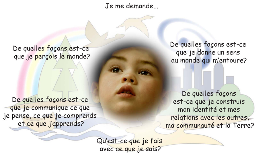
Figure I.1 : Les multiples façons de penser et d'apprendre chez l'enfant

Comme pour n'importe quelle exploration, la flexibilité est essentielle. Elle permet de tirer profit des situations d'apprentissage imprévues qui peuvent émerger spontanément en raison des suggestions des enfants.