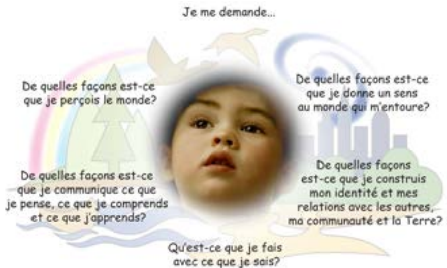
Figure I.1 : Les multiples façons de penser et d'apprendre chez l'enfant

Dans le contexte de la maternelle en immersion française, les enfants réfléchiront à ces questions dans leur première langue et ils communiqueront souvent leur pensée et leurs idées dans cette langue ou par des gestes, des dessins, etc. Il est alors fondamental que l'enseignant agisse comme modèle et comme facilitateur auprès des enfants afin de les guider, petit à petit, vers une utilisation plus autonome de la langue française.