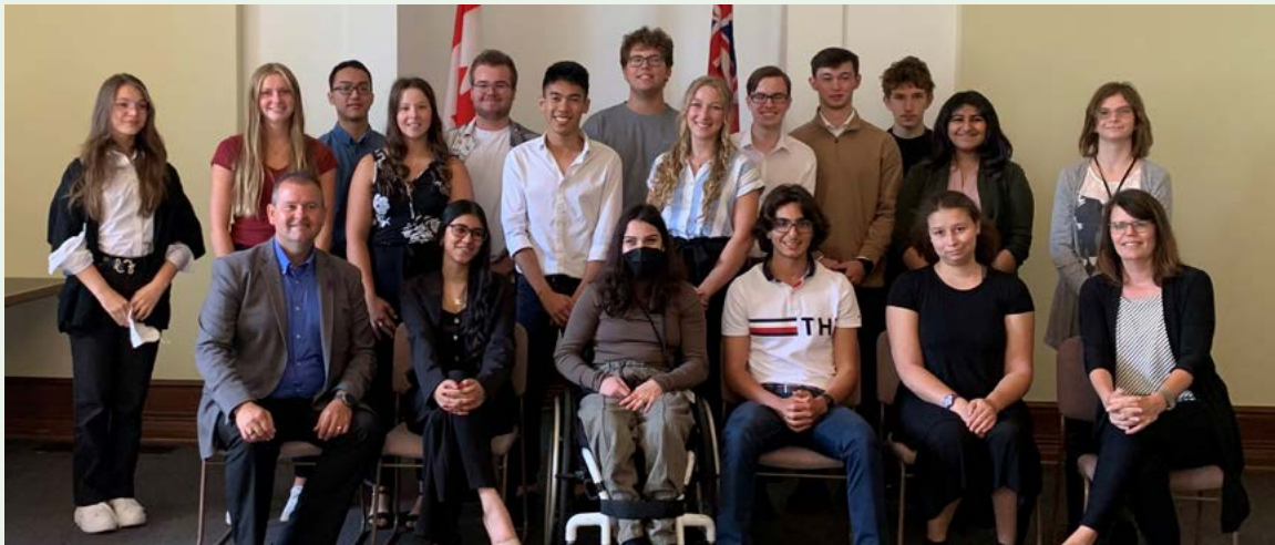
Membres du Conseil consultatif des élèves 2021-2022